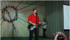
«Державна Благодійна організація України з «Канік-кю»