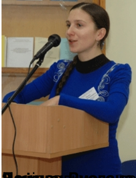
Олександрівна, асистентка кафедри драматургії (м. Київ) туду мистецтв