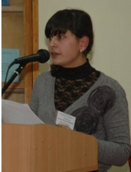
Володимирівна, студентка другого курсу факультету менеджменту У