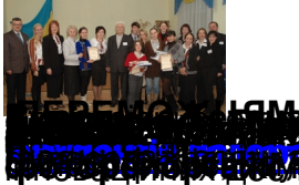
ІНТЕРВ'ЄТ СТУДЕНТІВ З УКРАЇНСЬКОЇ МОВИ, радіостанції