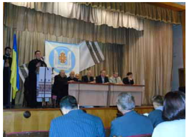
Фото 2. Привітання священнослужителів для учасників конференції